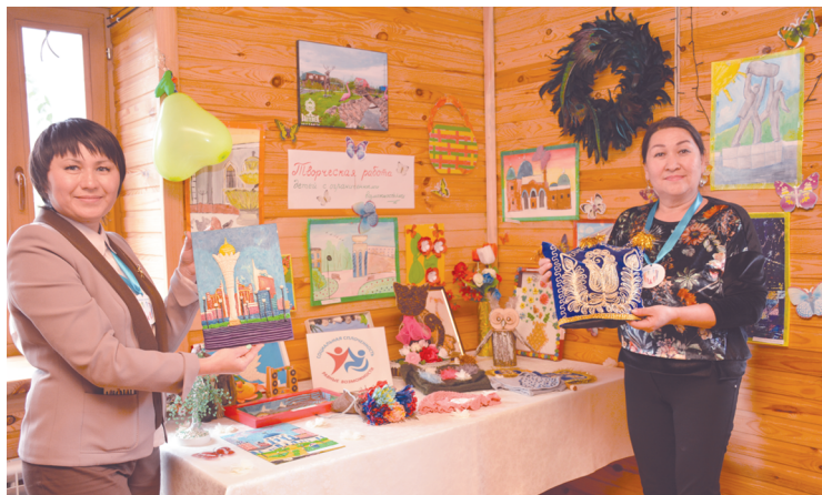
игры. Спасибо большое организаторам за этот незабываемый праздник для наших детей.