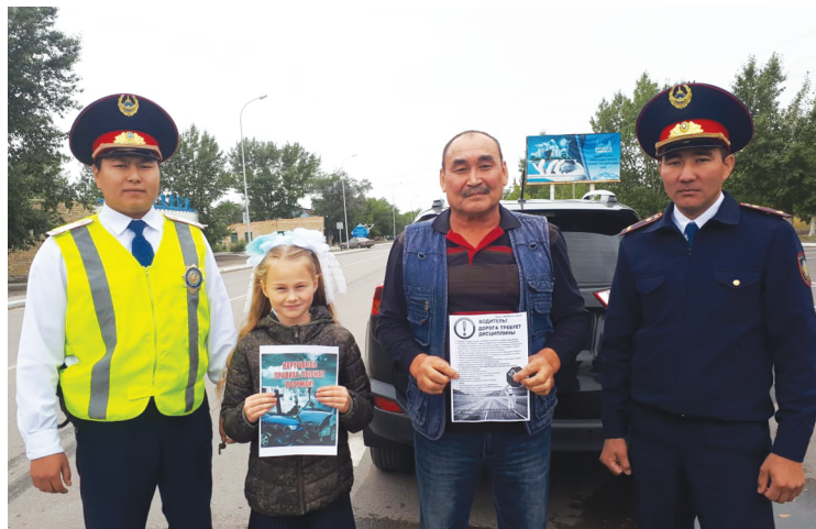
Управление полиции Бухар-Жырауского района

С 1 сентября в каждой школе района в рамках ОПМ «Внимание – дети!» инспекторы ювенальной полиции проводят с учащимися занятия по обучению детей безопасности дорожного движения и навыкам поведения на дорогах.