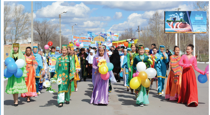
(Продолжение читайте на 4 стр.)

С раннего утра в день Первого мая на площади у Дома культуры п. Ботакара звучала музыка и шла оживленная подготовка к празднику. Участники районных ЭКО расстилали дастарханы и выставляли на них привезенную снедь. Пышными караваями украшен стол ЭКО «Славянка» из с.Баймырза. Этот коллектив отмечает в этом году 10-летний юбилей, с чем мы их и поздравляем! У «Славян» из п.Ботакара стол ломится от всевозможных блинов, кулебяк, пышек и ватрушек. Как всегда, удивляет и радует ЭКО «Сударушка» из с.Центральное: как из рога изобилия, одно за другим, появляются на столе яства - вешенки уже этого года, огурцы малосольные, растегаи с мясом. И даже янтарный сироп из кленового сока.