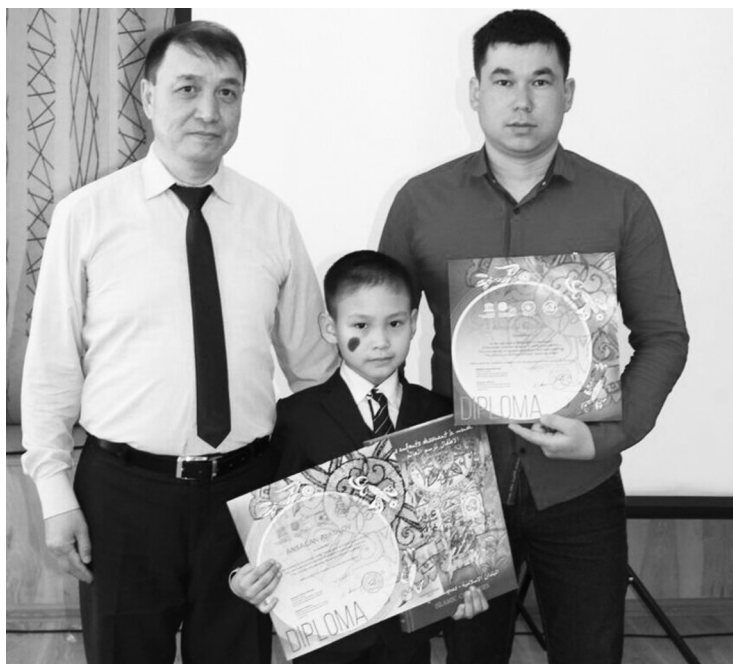
өнер мектебінің жеңісі ЮНЕСКО дәрежесінде екендігін айтып өткіміз келеді. - Бір қуантарлығы «Бұқар