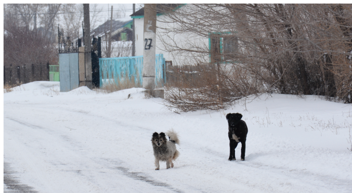
Телефон «прямой линии» - 2-18-85. Звоните! Пишите

Стаи бродячих собак замечены и на других улицах. Опасно ходить на улице Б.Момышулы, Шопаная, Амангельды. Собаки сопровождают идущих из магазина и готовы вырвать пакеты с продуктами. Бродячие собаки хозяйничают и во дворах, и владельцам домашних птиц приходится караулить своих кур, уток, гусей. Опасно подходить и к мусорным контейнерам - здесь тоже орудуют бродячие животные - собаки, кошки.